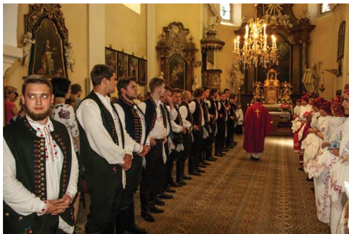
Svatodušní slavnosti