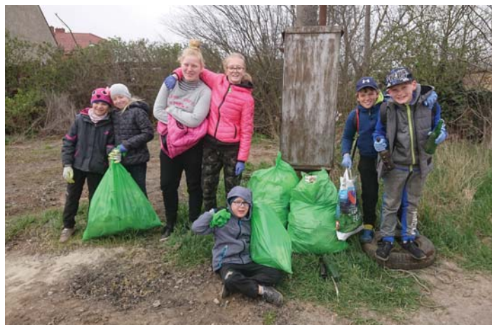
Uklízíme Troubsko

Největší nepořádek byl v okolí benzinky pod dálnicí. Toto místo leží v katastru Troubska, ani není příliš vzdálené od zástavby, ovšem odpady se tam hromadí od lidí z celé republiky a nepochybně i od zahraničních návštěvníků. Bylo nad síly dobrovolníků celou oblast uklidit a pravděpodobně jejich práce již zmizela pod dalšími vrstvami odpadu. Plné ruce práce/odpadků měly i skupinky, které se vydaly směrem na Popůvky a na Střelice. Pokud to šlo, rozříděný odpad (hlavně plast a sklo) jsme vyhodily do kontejnerů v obci. Směsný odpad čekal