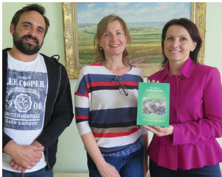
Předání knihy

můžete dýchat a vědět, že žijete! A pokud NEVÍTE JAK? Přečtete si tuto knihu plnou krás přírody ze srdce jedné ženy, která píše tak, abyste se i doma v obýváku mohli přenést v myšlenkách do srdce národního parku Vysokých Taur.