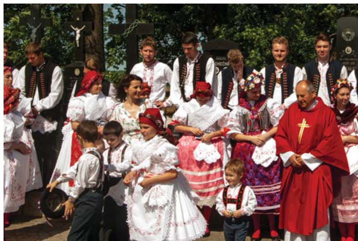
Svatodušní slavnosti