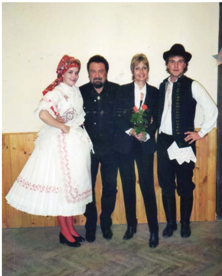
Waldemar Matuška v Troubsku

Je známo, že v minulých letech se uskutečnilo mnoho návštěv umělců zvučných jmen u nás v Troubsku v KATOLICKÉM DOMĚ. Od roku 1992 do současnosti vystupovali zde zpěváci, herci a kapely hlavně díky podpoře obce Troubsko, která byla hlavním pořadatelem. Divadla zajišťoval Český zahrádkářský svaz Troubsko. Celkem to bylo 68 úspěšných vystoupení. V současné době pracujeme na fotoknize, kde budou všechny pořady a koncerty zdokumentovány, aby byla nějaká památka na vystupování všech hvězd v naší obci.