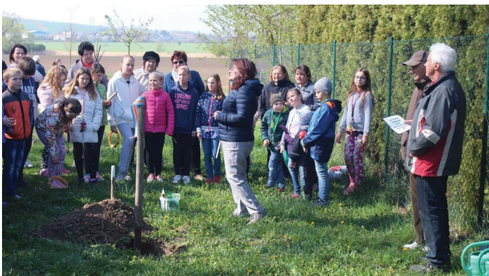
Sázení stromů