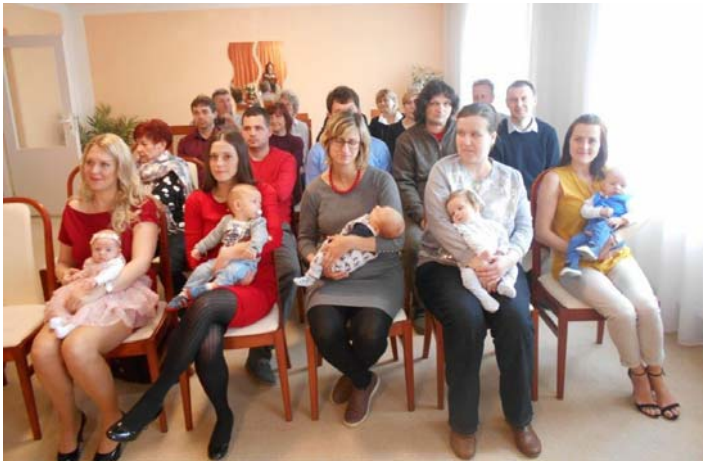
Vítání občáneků