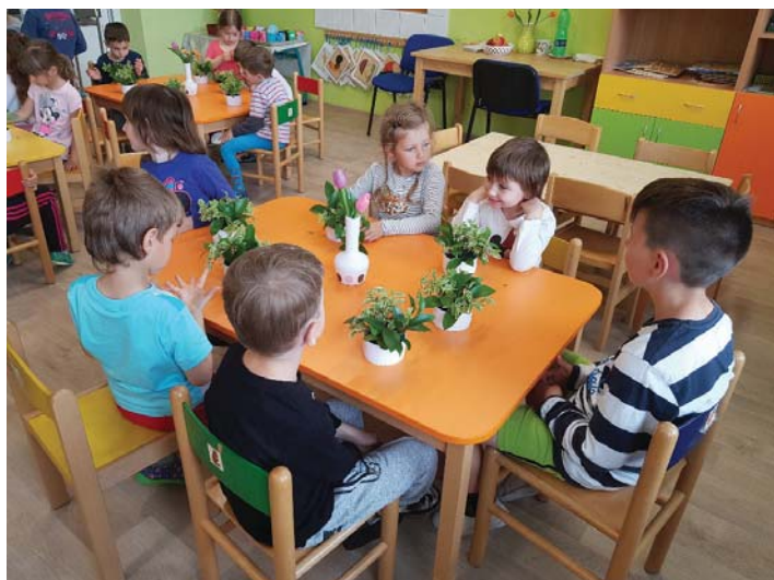
Tvoření pro maminky