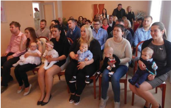
Vítání občáneků - foto obecní úřad