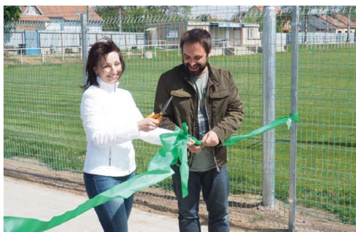
Slavnostní otevření hřiště

Obec to také neměla úplně jednoduché, vždyť kolik takových hřišť postaví za jedno volební období, aby se daly získat zkušenosti? Nicméně již před otevřením bylo jasné, jaké chyby jsou a že je bude nutno řešit v budoucnosti. Mezi těžko řešitelné