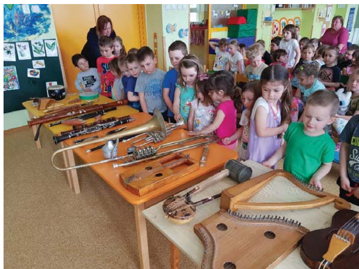
Hudební program v MŠ