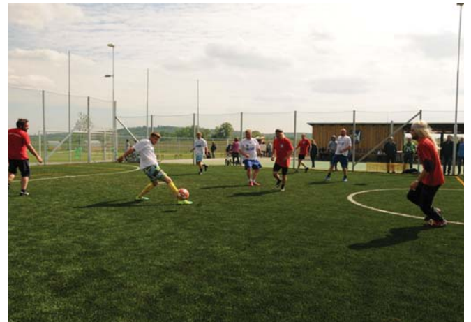
Zahajovací utkání

Provozní doba hřiště: PONDĚLÍ–NEDELE Květen–Říjen 2019 8.00–12.00 14.00–20.00