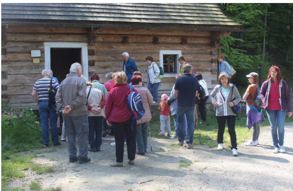
Výlet do Beskyd

Příjemně unavení po výletě jsme nastoupili do autobusu a šťastně dojeli do Troubska.