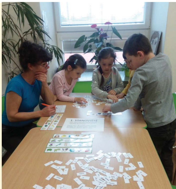
Soutěžení dětí v ZŠ