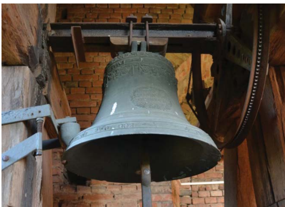
Troubská kaple a kostel