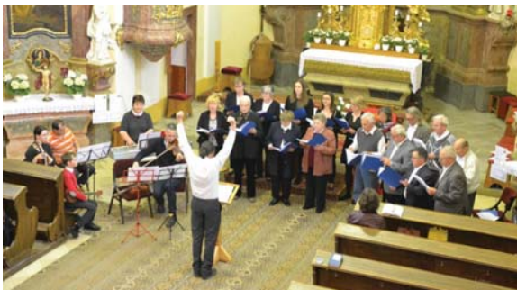
Chrámový sbor - foto I. Feit