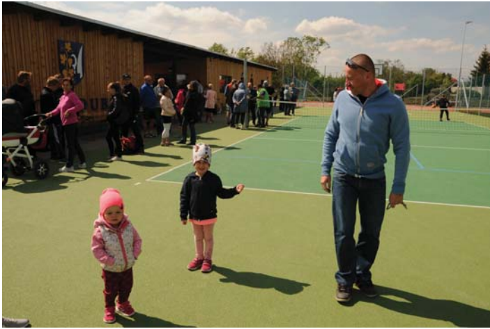
Posezení během slavnostního otevření hřiště

Uvědomme si, že i my, stejně jako ve všech věcech týkajících se obce, můžeme přispět ke zdárnému provozu svými nápady a náměty.