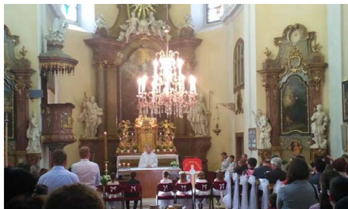
fotka z kostela 1. svaté přijímání