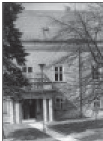
Vstup do zámku