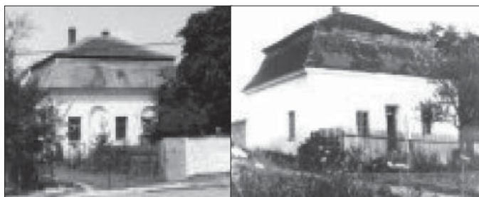
Pavilon na Zámecké ulici

Původní zahradní pavilony, vybudované v zámecké zahradě v době Sekenberků.