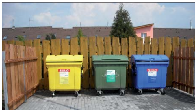
Kontejnery na Ostopovické ulici

Děkujeme, že do třídění odpadů se zapojuje stále více občanů, kteří chápou třídění jako jednu z cest, jak přispět k ochraně životního prostředí.