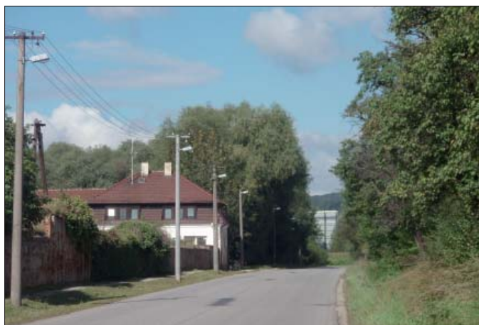
Přestavěný pavilon na ul. Polní

Pavel Veleba (podklady soukromé a staré kroniky)