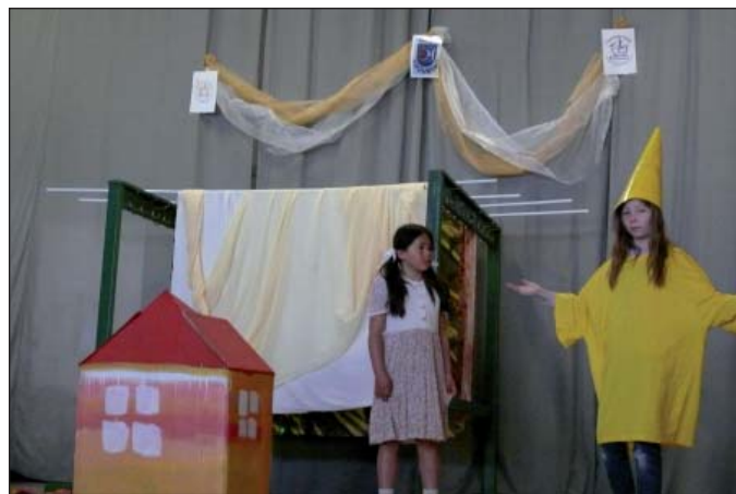
Jedno z představení