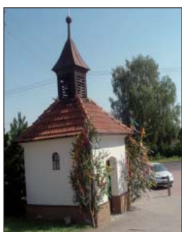
Kaplička svatého Leopolda na Veselce (13)

Kříž z roku 1882 věnoval František Kroupa z Troubska, číslo 33. Je umístěn na levé straně ve výklenku u sakristie, kam byl přeložen v roce 1965. Původně stál před kaplí na prostranství před ní, později přímo po levé straně vchodu do kaple.