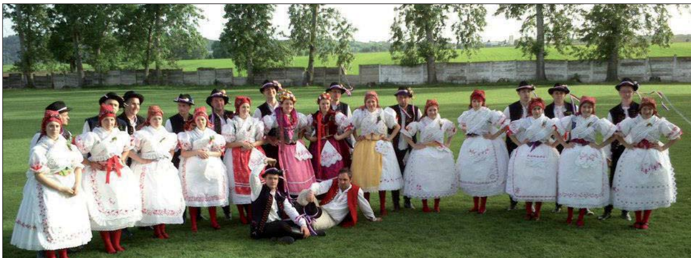
Troubský soubor Podskalák