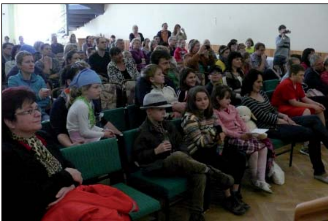
Návštěvníci (v 1. řadě paní startostka)