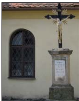
Kříž u troubské kaple Věch svatých (12)

Kříž z roku 1882 věnoval František Kroupa z Troubska, číslo 33. Je umístěn na levé straně ve výklenku u sakristie, kam byl přeložen v roce 1965. Původně stál před kaplí na prostranství před ní, později přímo po levé straně vchodu do kaple.