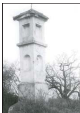
Boží muka nad Veselkou (17)

Obrazek byl obnoven v roce 1997. Je umístěna u farního kostela na protější straně vstupu na spodní část hřbitova.