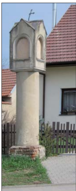
Sloupová Boží muka (14)