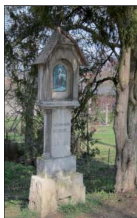
Boží muka u farního kostela (16)

1. ledna 2007 byla zdemolována nákladním autem, které se na náledí stalo neovladatelným. Po zdokumentování byla odstraněna s tím, že po vybudování kruhového objezdu, tam bude znovu postavena.