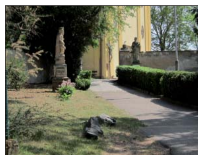
Socha sv. Floriána (19)